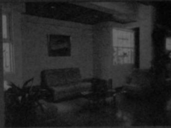
Capillas de velación

100 m sur de la Iglesia San Bosco Teléfonos: 33-6066, 22-9022 y 33-0811