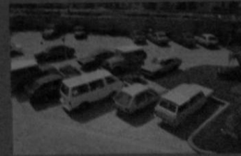
Amplio parqueo vigilado