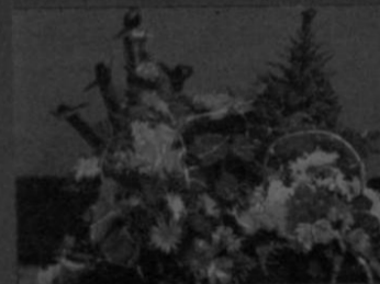
Servicio de floristería