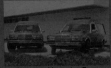
Carrozas Mercedes Benz último modelo