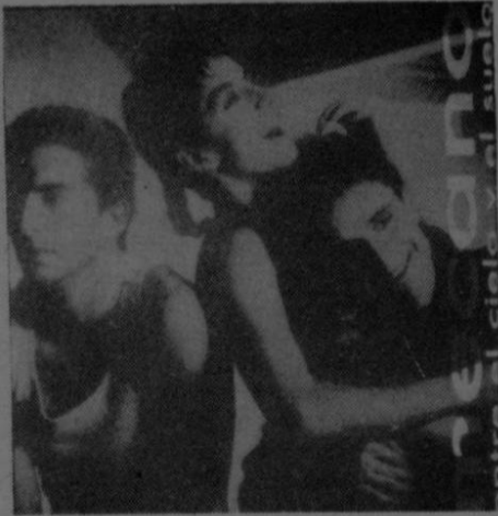
El trío "Mecano" siempre con su particular estilo, acaba de lanzar este disco titulado "Entre el cielo y el suelo" y en él sobresalen las canciones "Ay que pesado" y "Esta es la historia de un amor".