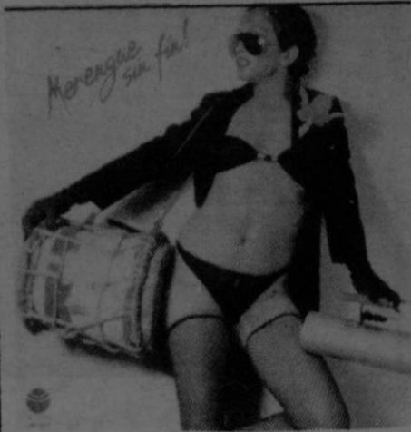
Para los merengeros acaba de salir este disco que lleva al ritmo dominicano canciones como "Al ritmo de la noche", "Cobardía", "El jardinero", "Colegiala" y "Tus besos". "Merengue sin fin" es el nombre del álbum.