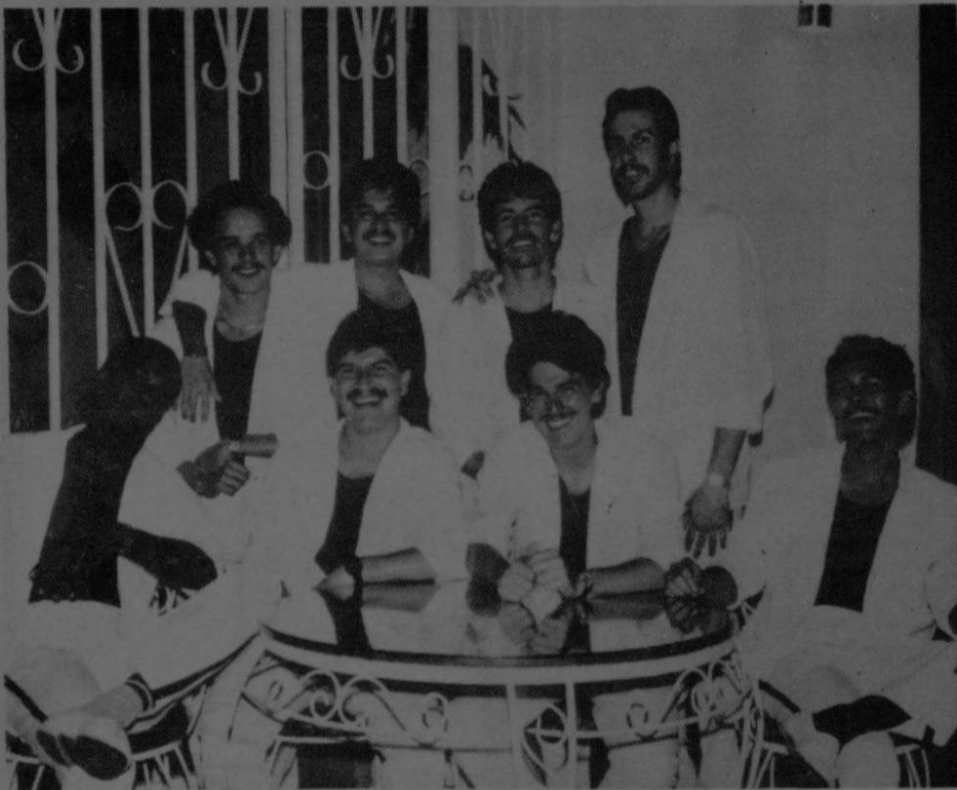
La próxima semana "Karibú" estará en los estudios de grabación preparando los temas de su nuevo disco sencillo.