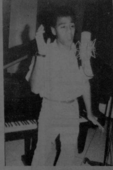
En los estudios de grabación...