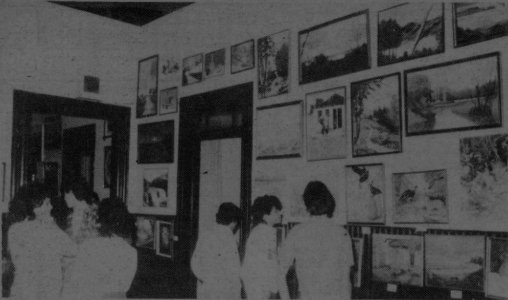
EXPOSICION DE FIN DE CURSO. Abierta al público se encuentra durante esta semana, la exposición y venta de pintura y escultura de los alumnos de la Casa del Artista. (Montero)