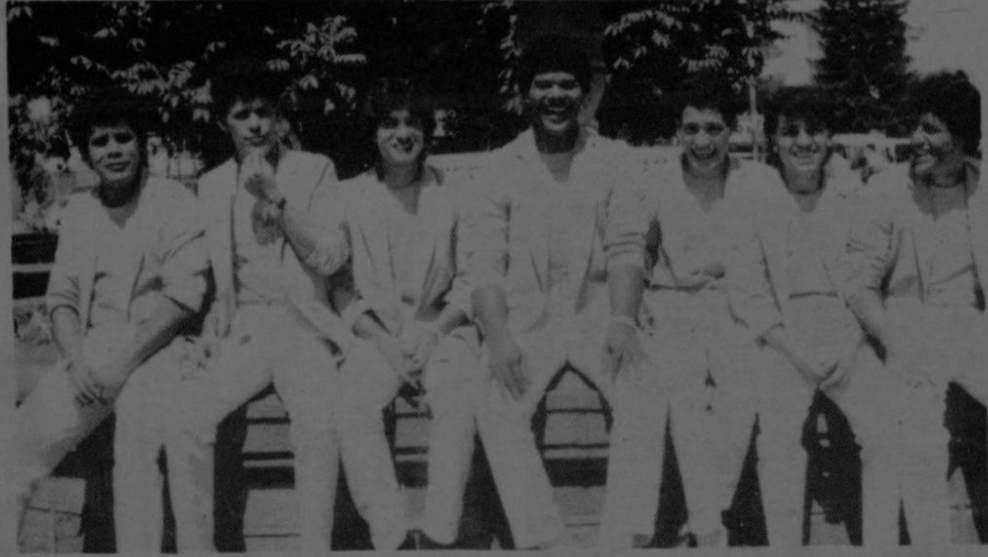
El grupo “Néctar” celebrará su tercer aniversario la semana entrante.

tar” grabó un videoclip de la balada “Como la primera vez” que será presentado en los próximos días. Mientras tanto anuncian que para conmemorar su creación han preparado una serie de bailes especiales, cuya programación de seguido presentamos: Lunes 1º de Dic. Disco Salsa 54 con “Opus 4” y “Tren Latino”. Martes 2: Concierto de aniversario en el Centro Comercial del Sur, a las 6:30 p.m. Miércoles 3: Discoteque Miraflores con “Karibú”. Jueves 4: Colocoloco con “La Empresa”. Viernes 5: Les Moustaches. Sábado 6: Hotel Cariari. Domingo 7: Palacio Municipal del Guarco, Cartago. Lunes 8: San Juan Sur, Desamparados.