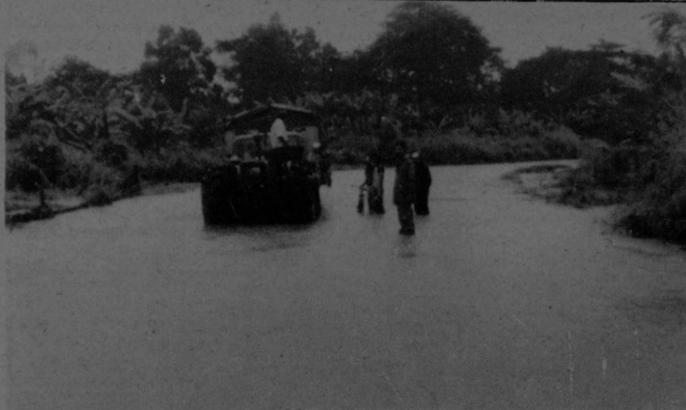
Miembros de la Guardia de Asistencia Rural de Corredores, colaboraron activamente en las recientes inundaciones ocurridas en el lugar conocido como El Roble de Corredores. La grática recoge el momento preciso en que ayudaban a uno de los damnificados.