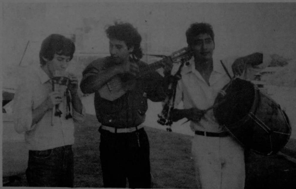
Ellos son el trío suramericano "Raíces" que está de paso por el país. (Castillo)

En nuestro país ya han realizado algunas presentaciones con fines culturales y la próxima de ellas será el martes entrante en Baleares, San Pedro.