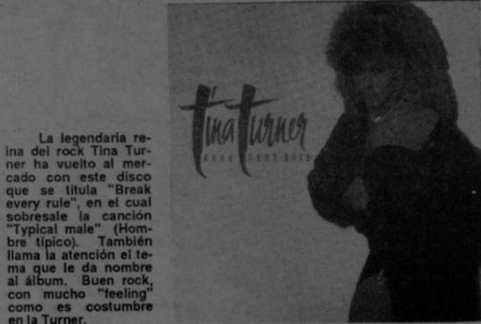
La legendaria reina del rock Tina Turner ha vuelto al mercado con este disco que se titula "Break every rule", en el cual sobresale la canción "Typical male" (Hombre típico). También llama la atención el tema que le da nombre al álbum. Buen rock, con mucho "feeling" como es costumbre en la Turner.